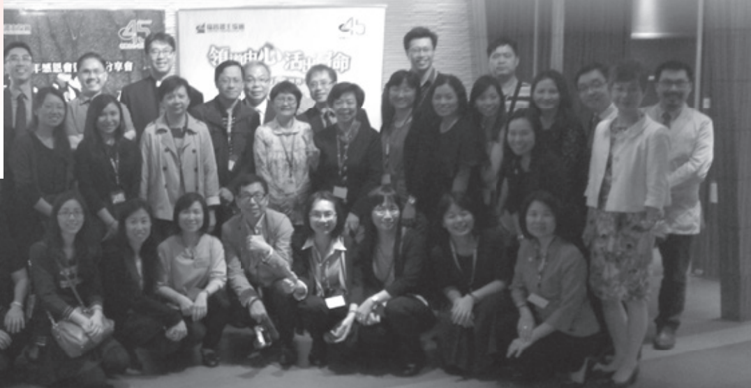
證主團隊攝於感恩會